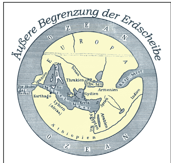
Abb.2 Milesische Weltkarte (nach Anaximander und Hekataios von Milet, um 510 v. Chr.)

Der Ursprung des Namen Europas dürfte wahrscheinlich im semitischen Wort ereb , was so viel wie Abend bedeutet, liegen. Charakteristisch für den Kontinent ist die Tatsache, dass er als einziger Erdteil nicht rundherum von Wasser umgeben ist. Damals wie heute ist die Grenzziehung zwischen Europa und Asien viel diskutiert und heftig umstritten, es existiert bis zum heutigen Tag keine völkerrechtliche Definition dieser Grenze, deshalb wird auch oft von „Eurasien“ gesprochen. Bereits im 8. vorchristlichen Jahrhundert, der Zeit des griechischen Dichters Homer , war Europa eine gängige geographische Bezeichnung, allerdings nur für das griechische Festland im Gegensatz zu Peloponnes und den Inseln (vgl. Homerischer „Hymnus an Apoll“).