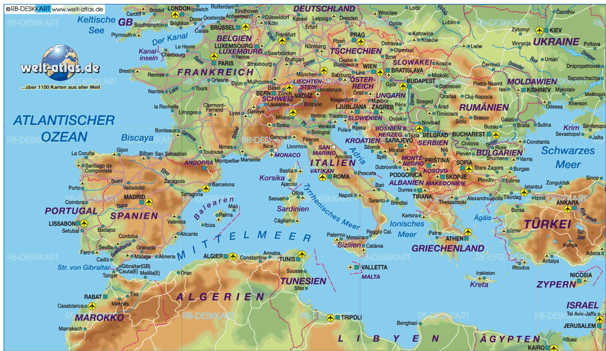
Abb.6 Karte von Südeuropa