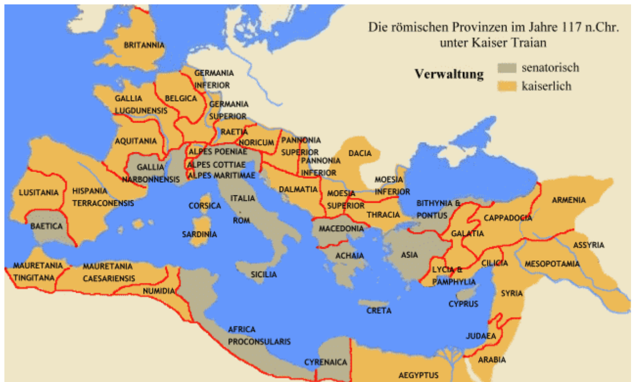
Abb.1 Größte Ausdehnung des römischen Reichs – unter Kaiser Trajan 117 n. Chr.

Verfasser: Benjamin Kurt Manfred Schuler